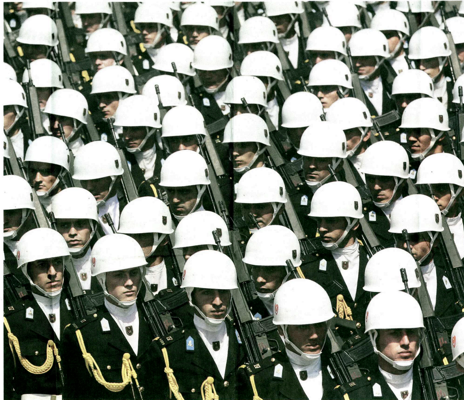
Schweben über allem: Die Streitkräfte sind im Lande Kemal Atatürks immer noch ein unantastbares Nationalheiligtum.

Selbst wenn sich ehemalige Offiziere im Rahmen des Ergenekon-Prozesses derzeit zum ersten Mal in der Geschichte des Landes vor einem zivilen Gericht verantworten müssen, selbst wenn nach dem Tod von 16 jungen Soldaten während der PKK-Anschläge im September und Oktober die Strategie der Armee ungewohnt offen kritisiert wurde – das Militär ist in der Türkei noch immer ein Nationalheiligtum. Mit seiner Hilfe hatte Kemal Atatürk die Republik einst von den europäischen Besatzern befreit, seither gilt der Waffendienst als erste Bürgerpflicht. „Jeder Türke wird als Soldat geboren“, skandierten die Feuerwehr- und Pfadfinderclubs der Nation bei der Parade zum 85. Republikgeburtstag; schon in der Grundschule werden