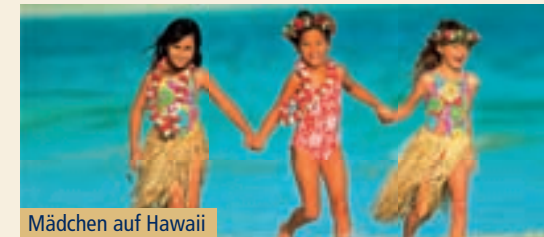
Mädchen auf Hawaii

Holland America A TRADITION OF EXCELLENCE BRITISH AIRWAYS