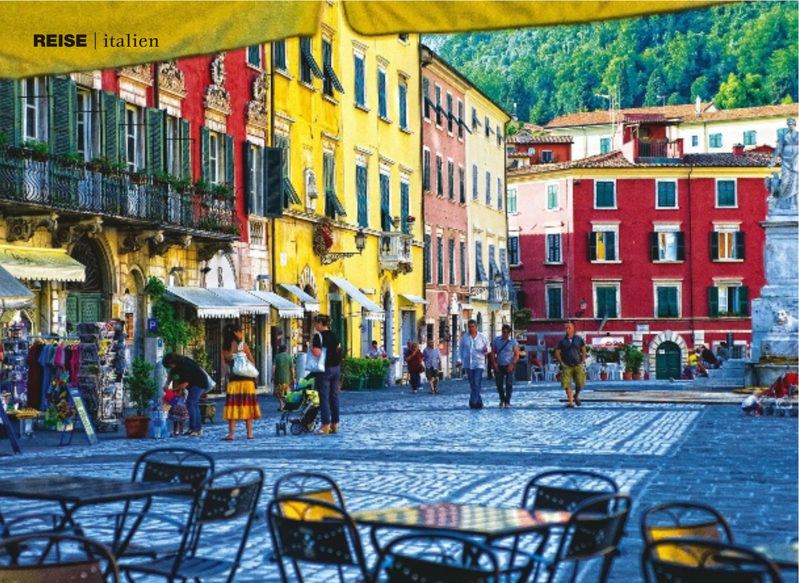
Verzauberung auf Italienisch: die Piazza Alberica von Carrara, führungsstarke Tanzpartner in der Diskothek „Pirata“