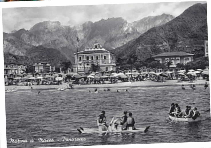
... und der Blick ins Grüne bei Marina di Massa

erschien: das „Tirreno“, eine schöne Jugendstilvilla, direkt an der Strandpromenade von Marina di Massa gelegen. Es ist Freitagnacht. Vespa-Geröhr lässt die Scheiben erzittern. Statt „Marina“ wummert Techno aus offenen Autos. Schlaflos wälze ich mich in den Kissen herum. Nur meine Mutter, sonst beim leisesten Geräusch hellwach, schlummert tief.