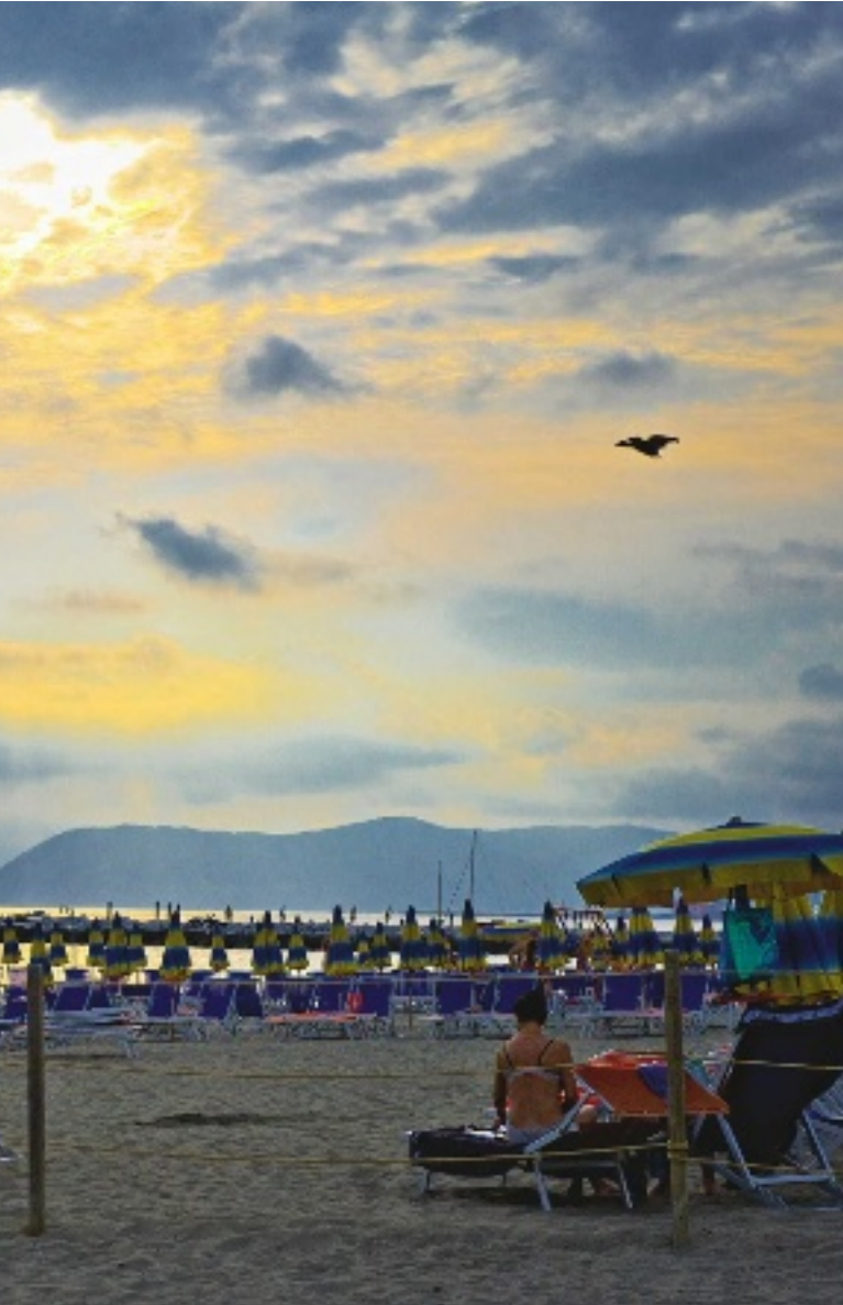
... und ein Amore-tauglicher Sonnenuntergang am Meer

Schirm und Liegestuhl. Als wir endlich zwei Liegen ergattert haben, spüre ich, wie ich mich entspanne. Meine Mutter scheint wieder wie immer: Von der Nagelschere bis zur Sonnencreme hat sie alles Überlebenswichtige in ihrer Tasche, regelmäßig ermahnt sie mich, mich neu einzureiben. Ich fange an zu grübeln: Wie gut kenne ich die Frau neben mir wirklich? So, wie sie mir jetzt eine Cola reicht, nur weil ich kurz über die Hitze klage, ist sie mir seit Kindheit vertraut – als Kümmererin und Trösterin. Das übermütige, ein bisschen kokette Bikini-Mädchen auf den Fotos war mir dagegen stets fremd, ja, suspekt sogar: Fürsorge darf man von einem Gör mit dieser Hochsteckfrisur sicher nicht erwarten, eher handfeste Flausen. Womöglich gar weibliche Konkurrenz? Seit wir hier sind, drängelt sich die Kleine auf jeden Fall energisch nach vorn. Und ich bin damit komplett überfordert. „Alles ist so leicht hier, so unbeschwert!“, hatte meine Mutter vorhin noch geseufzt. Da lehnte sie an der Strandbar, eine Weinschorle in der Hand, hübsch sah sie aus und mindestens zehn Jahre jünger. Und ich hockte daneben, ein trotziges Kind, das in seine Cola starrte, weil die Mama es wagte, einmal nicht nur Mama zu sein.