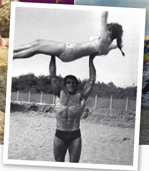
Italiens Trümpfe: Marmor aus Carrara, Sixpack-Kerle heute und 1964